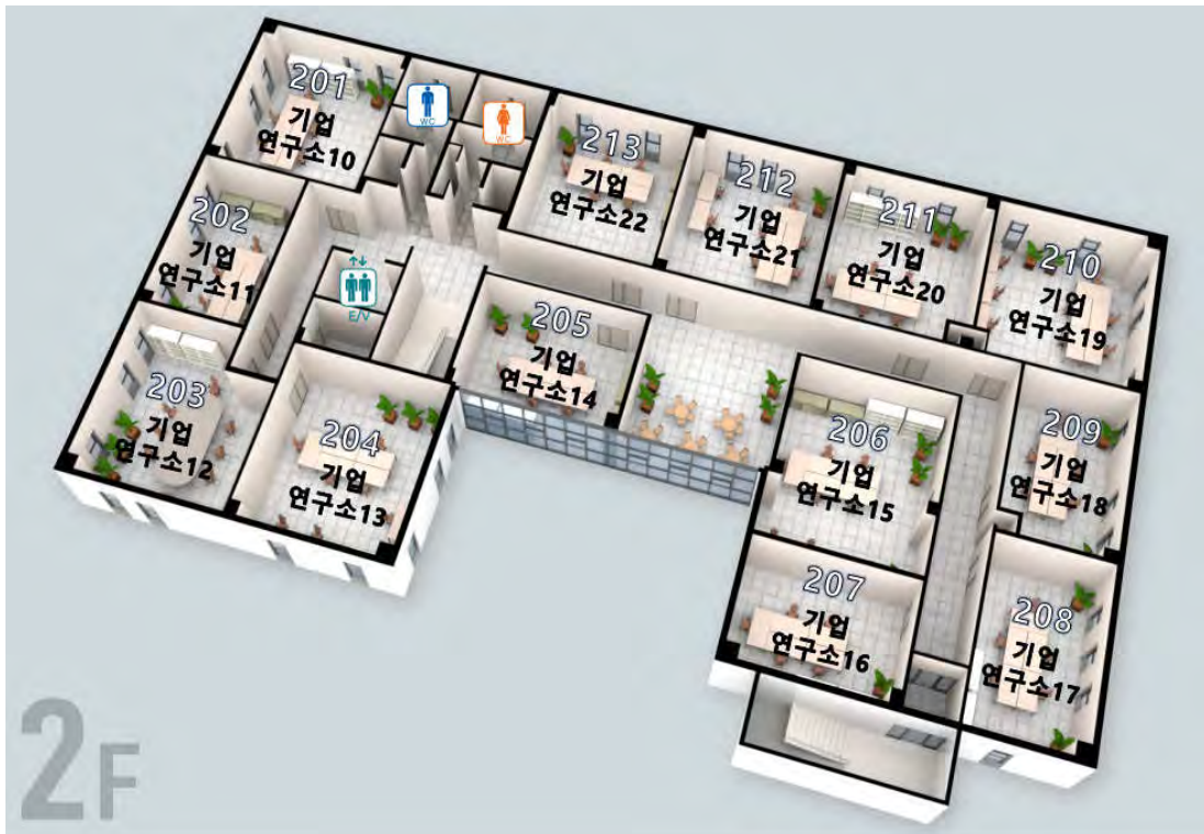
【기업연구관 2층 평면도】