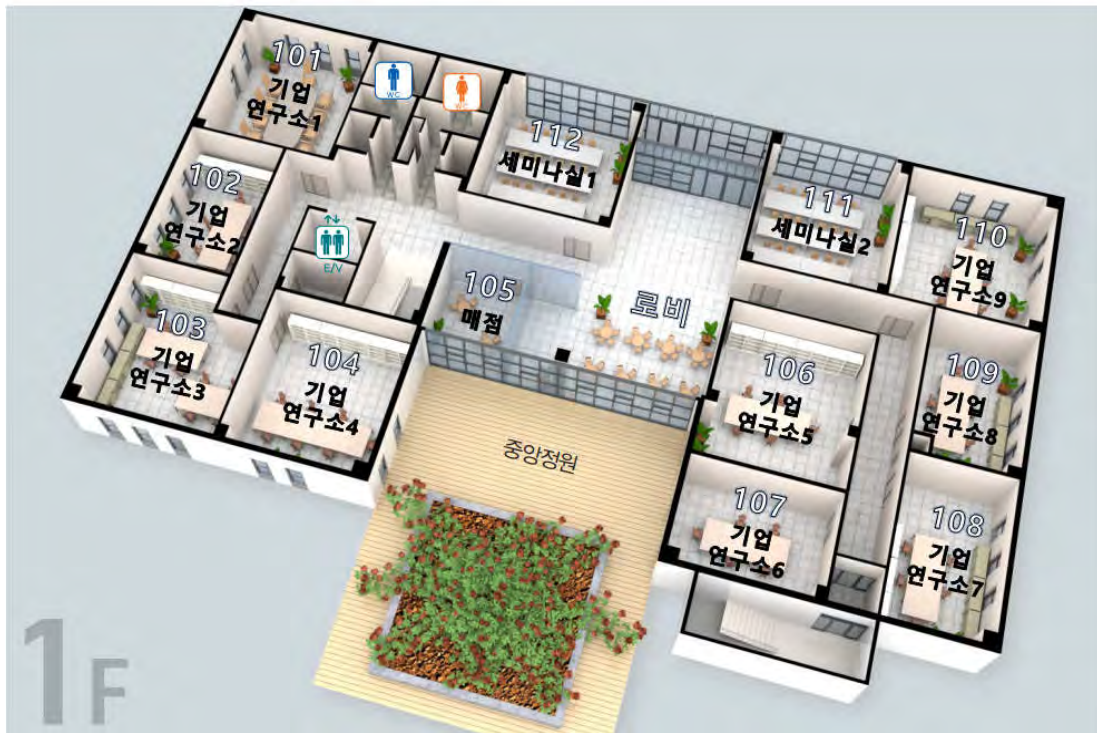
【기업연구관 1층 평면도】